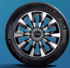
إطارات 19 إنش